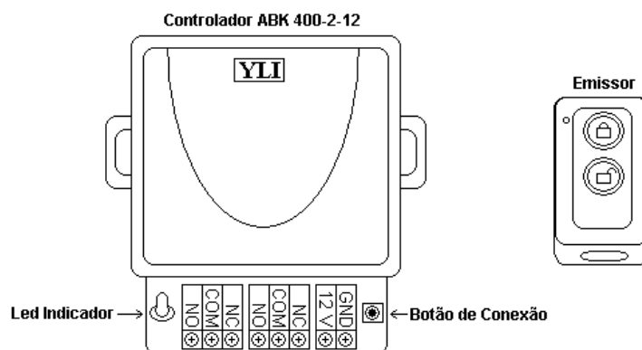
Figura 1. Partes principais do controlador

O controlo de acesso com comando remoto ABK-400-2-12 está concebido para accionar qualquer tipo de trinco, fechadura ou sistema eléctrico utilizado na abertura de portas. O controlador está formado por duas componentes básicas: (1) Controlador e (2) Emissor (Ver Figura 1 com detalhes)